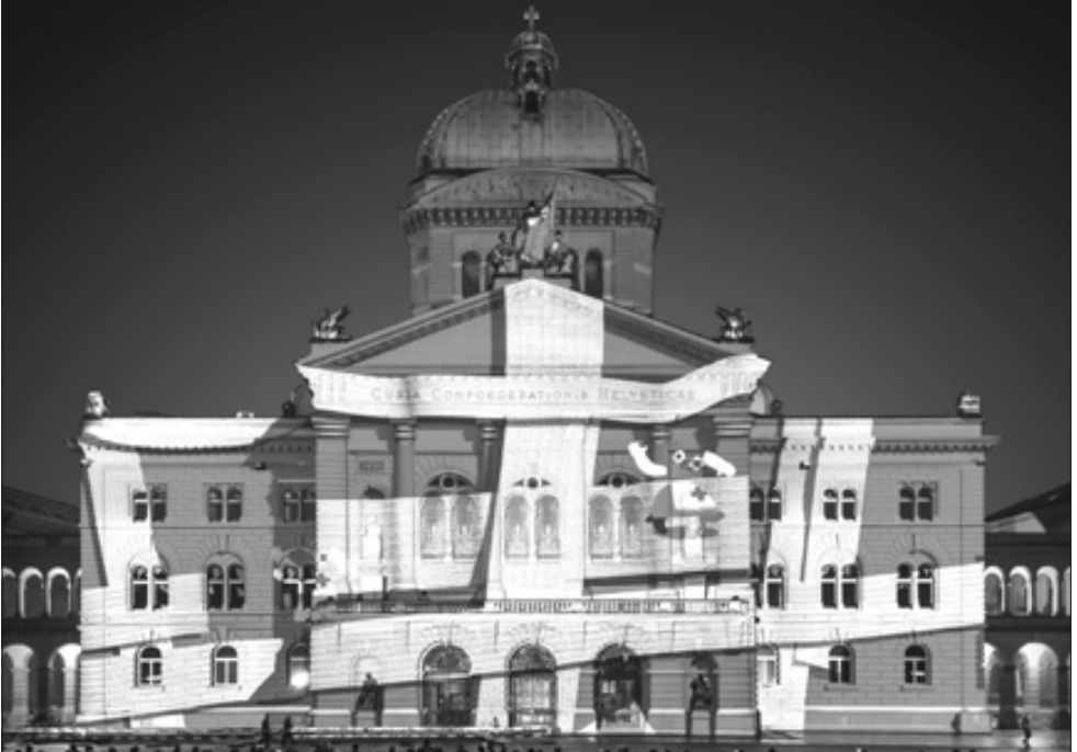
Rendez-vous Bundesplatz Lichtzauber am Bundeshaus Bern