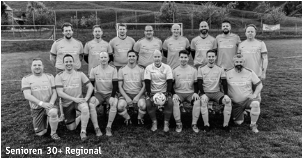
Senioren 30+ Regional

Leider werden einige unserer treuen Spieler eine Reihe kürzertreten oder ganz mit dem Fussballspielen aufhören. Für den geleisteten Einsatz und die vielen gemeinsamen Mo-