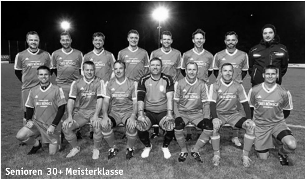
Senioren 30+ Meisterklasse

Wir danken an dieser Stelle allen Beteiligten, die in irgendeiner Form unserem Team helfen und es unterstützen. Nach dieser etwas verfahrenen Saison freuen wir uns alle darauf, in der nächsten Saison wieder richtig anzugreifen und uns in der vorderen Hälfte der Tabelle anzusiedeln.