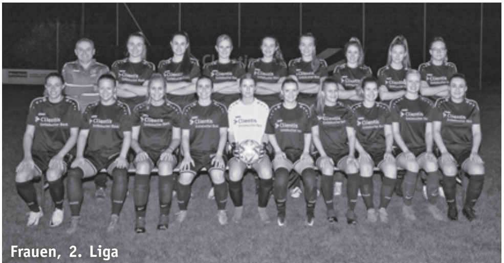
Frauen, 2. Liga